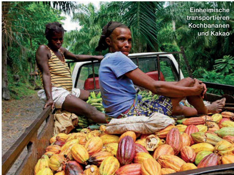
Einheimische transportieren Kochbananen und Kakao

Ausgesprochen slow geht es ansonsten meist zu im zweitkleinsten Land Afrikas irgendwo mitten im Atlantik. Nur die Seychellen im Indischen Ozean auf der anderen Seite von Mama Afrika sind noch ein bisschen kleiner. Die Hauptinsel São Tomé hat die Größe von Berlin, Príncipe knapp von Saarbrücken. Leve-Leve heißt das Motto am Äquator, was so viel heißt wie langsam, langsam. Das hat durchaus seinen Reiz für die wenigen, oft gestressten Urlauber aus Europa, die den Weg auf die vulkanischen Eilande mit ihrer üppigen tropischen Vegetation und den menschenleeren Bilderbuchstränden finden. Kann aber auch Probleme bereiten. Insbesondere immer dann, wenn die knappen Urlaubstage durchstrukturiert sind und Dinge nicht so funktionieren, wie sie eigentlich funktionieren sollten. Und das passiert öfter mal und hat Tradition.