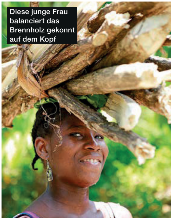
Diese junge Frau balanciert das Brennholz gekonnt auf dem Kopf

Liebe von vollkommener Schönheit, geboren im Schoße des Atlantiks, 31 Millionen Jahre alt: Príncipe! Ein Juwel aus schwarzer Lava, über und über bewachsen mit dichtem Regenwald, dem Lebensraum zahlreicher Vögel, viele endemisch. Seit 2012 Unesco-Biosphärenreservat, seit Menschengedenken paradiesisch, umgeben von goldgelben Stränden, in denen man morgens nur eine Fußspur entdeckt. Nämlich die eigene vom Abend zuvor. Eine kleine Insel mit gerade mal 5.000 Menschen, die in ein paar Hundert wackligen Holzhäusern leben. Richtig los ist eigentlich nur sonntags etwas, wenn sich die gläubigen Christen zum Gottesdienst in den