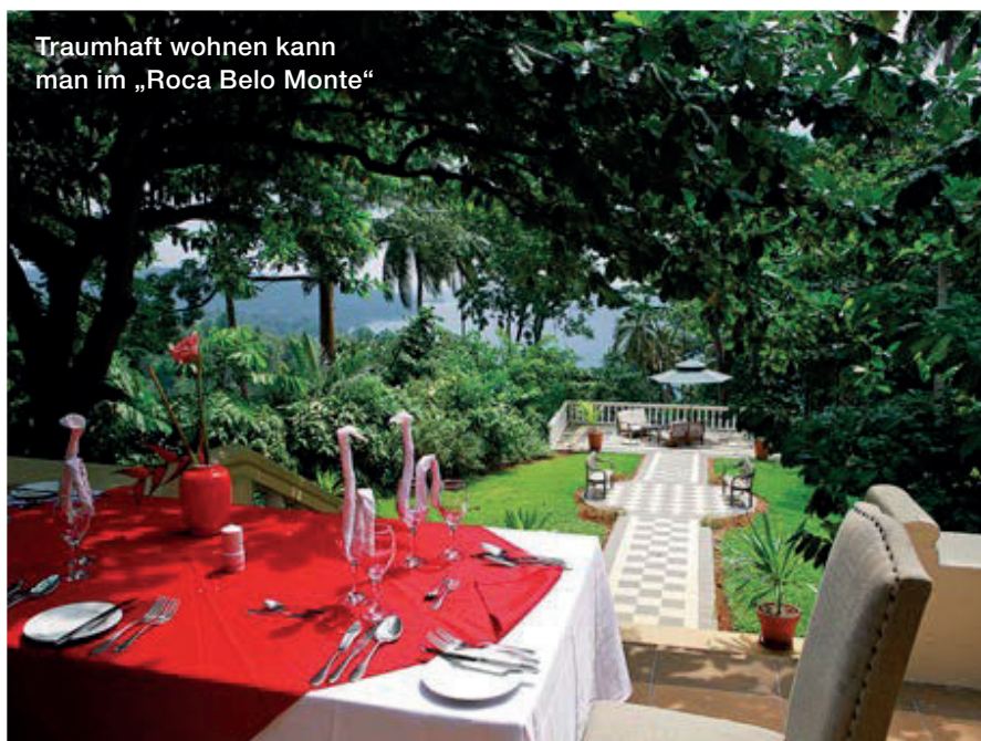
Traumhaft wohnen kann man im „Roca Belo Monte“

Mit dem Abzug der Kolonialmacht Portugal und dem Aufbruch in die Unabhängigkeit 1975 verfiel das Land in eine bleierne Agonie. Anstatt die beiden landschaftlich bezaubernden Flecken Erde mit ihren reichen natürlichen Ressourcen in eine prosperierende Zukunft zu führen, haben es die Politiker gründlich vermässelt. Ein trauriger Mix aus Vetternwirtschaft, Inkompetenz, Korruption und Machtbesessen-