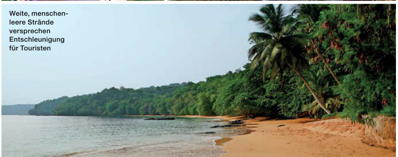
Weite, menschenleere Strände versprechen Entschleunigung für Touristen